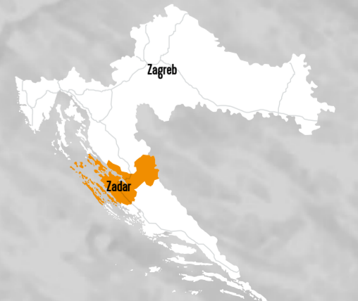
CROATIA IN EUROPE